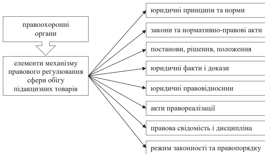
Рис. 1. Елементи механізму правового регулювання сфери обігу підакцизних товарів

На рисунку 1 зображено схему взаємодії елементів механізму правового регулювання сфери обігу підакцизних товарів.